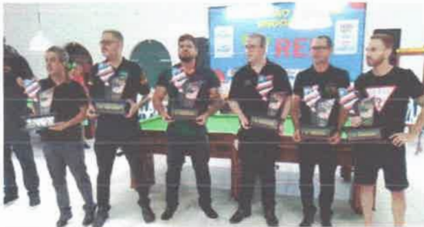
Feras da sinuca nacional conquistaram as melhores pontuações no Maranhão Open de Snooker Six Red 2023

cionais e locais que realizarem as maiores pontuações em uma mesma sequência de tacadas. "A competição será amparada nos instrumentos normativos da FMBS, considerando as regras do Snooker Six Red internacional e do regulamento dos Esportes do Snooker Nacional", finalizou o presidente Manoel Castro.