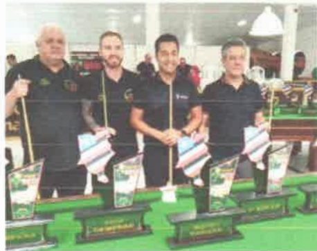
Atletas finalistas do Maranhão Open de Sinuca Snooker Six Red 2023