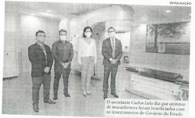
O secretário Carlos Lula diz que centenas de maranhenses foram beneficiados com os investimentos do Governo do Estado

Gov. do Estado investiu em serviços de assistência odontológica