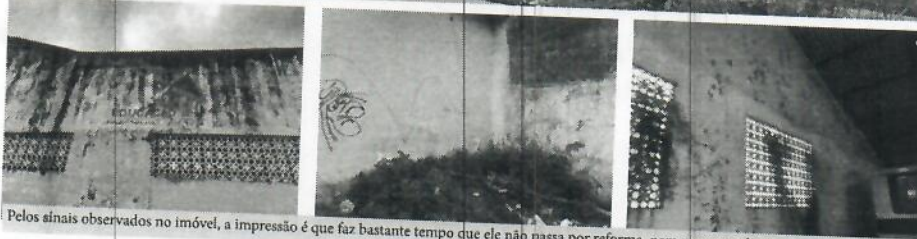
Pelos sinais observados no imóvel, a impressão é que faz bastante tempo que ele não passa por reforma, nem mesmo paliativa