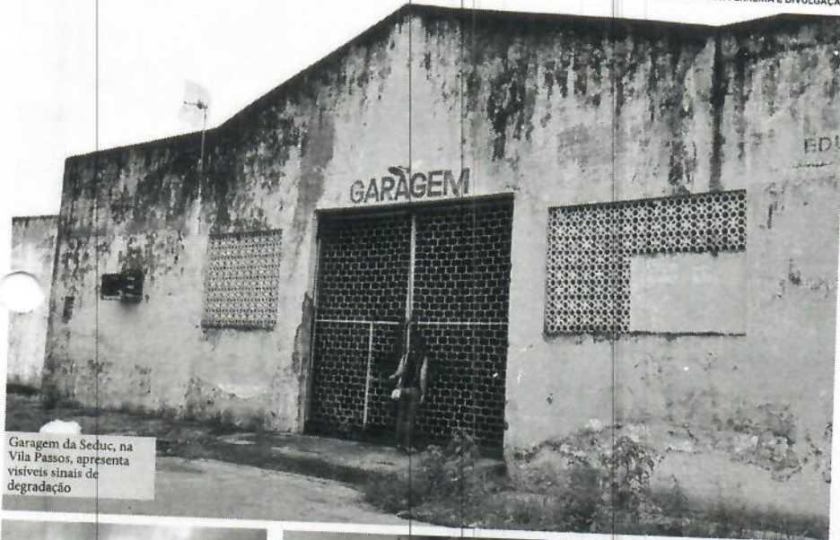
Garagem da Seduc, na Vila Passos, apresenta visíveis sinais de degradação