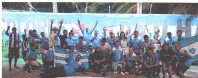
Torcida – FBI – Família Bicolores da Ilha

Além disso, a ajuda pode ser feita para a Casa Sonho de Criança através de trabalhos voluntários. Doações em dinheiro podem ser feitas, por meio da conta bancária: Banco do Brasil (Ag: 2972-6 / Conta: 117746-X) ou pelo Pix: gsolvida_10@hotmail.com. Para fazer parte desse grupo de paraenses solidários, efetue seu contato pelo Instagram Bicolores Da Ilha-São Luís: MA (@bicoloresdailha) ou pelo contato: 98 98133-2282.