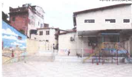
“Casa Sonho de Criança”, no bairro da Fé em Deus

A casa Sonho de Criança possui menores de 6 meses até os 18 anos, essas que já concluíram 18 anos, estão em processos de desligamento da