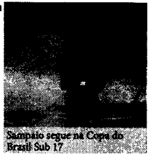
Sampaio segue na Copa do Brasil Sub 17

O Sampaio Corrêa está garantido, na 2ª fase da Copa do Brasil Sub-17. A classificação do Tubarãozinho, foi conquistada na quinta-feira (9), com uma vitória por 3x2 diante do Sant German-RO, em partida realizada no estádio Castelão em São Luís. Na próxima fase da Copa do Brasil Sub-17, o Sampaio enfrentará o Grêmio Atlético Sampaio-RR, que eliminou o Santana-AP. A previsão é que este confronto aconteça no dia 26 de abril.