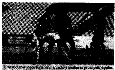
Time motense joga forte na marcação e amplia as principais jogadas da Bolívia