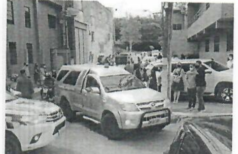
Cortejo sai da Igreja Batista do Angelim, em direção ao Cemitério Jardim da Paz, na Estrada de Ribamar