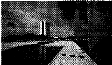
Ano legislativo no Congresso começa dia 3 de fevereiro. Antes, dia 1º, deputados e senadores vão eleger a nova Mesa Diretora das duas Casas. Primeiras matérias a serem analisadas serão 30 MPs, algumas delas perdem a validade nos próximos dias

contas das suas atividades, e será conduzida pelas novas Mesas das duas Casas, a serem eleitas no dia 1º de fevereiro”, declarou Alcolumbre em reunião red social. Da solenidade, deverá participar o presidente da República, Jair Bolsonaro; e o presidente do Supremo Tribunal Federal (STF), ministro Luiz Fux. Além de reforçar o sistema de segurança nas duas Casas, com a polícia legislativa – feito sempre na abertura das atividades legislativas e quando da visita de um chefe de Estado ao Parlamento, este ano, há também reforço nas medidas de segurança sanitária, tanto entre os congressistas, servidores, visitantes e jornalistas.