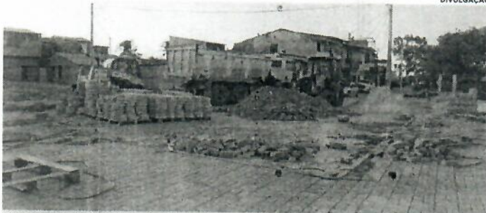
Obras de urbanização da Ponta do São Francisco, em São Luís

de pavimentação com blocos de concreto, revestimento e telhado dos caramanchões de lazer e instalação do guarda-corpo na extensão da orla marítima. Na próxima semana, será iniciada a implantação dos equipamentos da academia e do playground. 30 bancos, lixeiras e instalação dos postes de iluminação pública. Em uma área total de 8.144 metros quadrados, o projeto da obra contempla a construção de um completo centro urbanístico composto por praça, academia de ginástica, brinquedos infantis, caramanchões e coretos