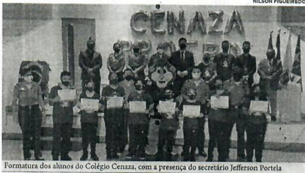
Formatura dos alunos do Colégio Cenaza, com a presença do secretário Jefferson Portela

O Proerd, um programa do Comando de Segurança Comunitária, busca, por meio de lições marcadas por muita interação, alegria e conhecimento, ensinar aos alunos a tomarem decisões seguras e saudáveis, a partir de informações sobre drogas, pressão dos colegas e bullying, entre outros temas