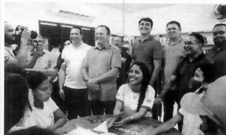
O governador Carlos Brandão durante a entrega da reforma do Centro de Ensino Cristino Pimenta, no município de Bacuri

O governador Carlos Brandão entregou, no domingo (24), a reforma do Centro de Ensino Cristino Pimenta, de três toneladas de peixes e 10 motores para pesca artesanal no município de Bacuri. A reforma do Centro de Ensino teve um investimento de R$ 638 mil e possibilitou uma estrutura completamente revitalizada para o prédio que conta com sete salas de aula e vai beneficiar 487 estudantes da região.