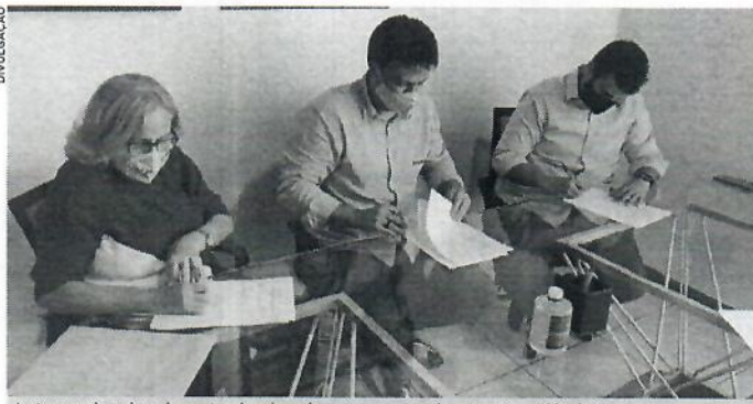
Assinatura de ordens de serviço das obras de equipamentos educacionais em Olinda Nova