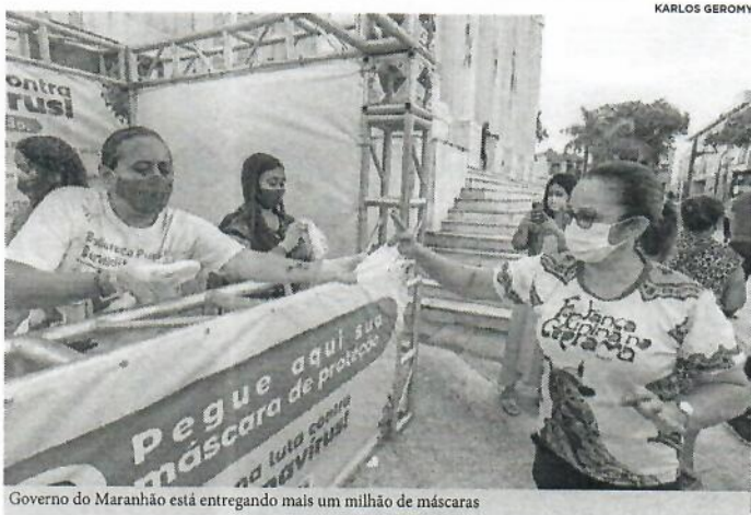
Gov. Maranhão está entregando mais um milhão de máscaras

A entrega é feita com o auxílio de bombeiros civis e respeita