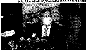
Presidente da Câmara, Arthur Lira, defendeu a PEC da Imunidade Parlamentar e avaliou que o direito a voz não é ilimitado.

O presidente da Câmara dos Deputados, Arthur Lira (PP-AL), defendeu a PEC da Imunidade Parlamentar em entrevista coletiva, nessa quinta-feira (25), e explicou que a regulamentação da imunidade parlamentar deve limitar-se à inviolabilidade de voz e voto, conforme o artigo 53 da Constituição, e não a outros artigos e temas referentes à imunidade parlamentar, como os artigos 52 e 14, vazados à imprensa. Antes, por meio de suas redes sociais, ele disse que não "é a favor nem contra qualquer solução legislativa específica sobre a proteção do mandato", que, afirmou, não protege o parlamentar, mas a democracia. "Sou a favor, sim, que o Congresso faça sua autocrítica e defina um roteiro claro e preciso para o atual vácuo legal para lidar com situações desse tipo", disse.