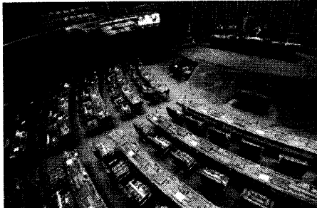
O Plenário do Senado começou a debater a PEC Emergencial, que cria mecanismo para retomada Auxílio Emergencial, mas votação ficou para próxima semana.

Adiada por mais uma semana a votação da chamada PEC Emergencial (PEC 186/2019), que trata de medidas fiscais e cria uma "cláusula de calamidade" para permitir o retorno do pagamento do auxílio emergencial. A proposta estava na pauta dessa quinta-feira (25), do Plenário do Senado, e foi adiada para a próxima terça-feira, 2 de março. O auxílio, que contempla famílias afetadas pela crise econômica causada pela pandemia da Covid-19, encerrou no final do ano passado, e desde então deputados e senadores vêm procurando retomar o pagamento do benefício. O relator da proposta, senador Márcio Britar (MDB-AC), nem apareceu no Senado nessa quinta — encontrava-se no seu estado. Acresce, que vive calamidade pública em decorrência do agravamento da pandemia, surto de dengue em várias cidades foram afetadas pelas enchentes de rios. Ele apresentou o parecer na segunda-feira (22), na forma de substitutivo. Apesar de constar na pauta desta semana, a votação