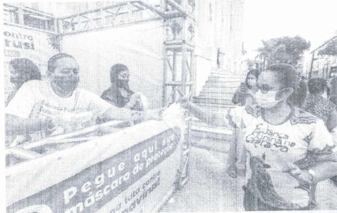
Governo do Maranhão está entregando mais um milhão de máscaras

Por dia, são entregues mais de duas mil máscaras em cada ponto de distribuição. Cada beneficiado recebe duas máscaras modelo KN95, que têm boa capacidade de filtragem e podem ser utilizadas por até 30 dias. A entrega é feita com o auxílio de bombeiros civis e respeita